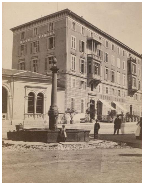
Dorfplatz vor dem Hotel Tamina mit Dorfbrunnen um 1870

In seiner Rede betonte Simon die Bedeutung des Feuerwehrwesens und würdigte die Arbeit der Feuerwehrleute. Er rief sie dazu auf, ihre Pflicht gewissenhaft zu erfüllen und weiterhin an ihrer Ausbildung zu arbeiten . Zudem forderte er die Behörden auf, die Feuerwehr in ihrer wichtigen Aufgabe zu unterstützen. Er erwähnte auch die geplanten Verbesserungen der Wasserversorgung in Ragaz, wie den Bau eines Hydrantennetzes , welches die Brandbekämpfung effektiver machen soll.