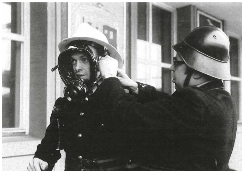
Bild 2: Vorbereitung der Atemschutzgeräte: Ein Feuerwehrmann wird für den Einsatz im stark verrauchten Kellerraum ausgerüstet.

Aus dem Kommandantenbericht 1975 von Ernst Gaffner: