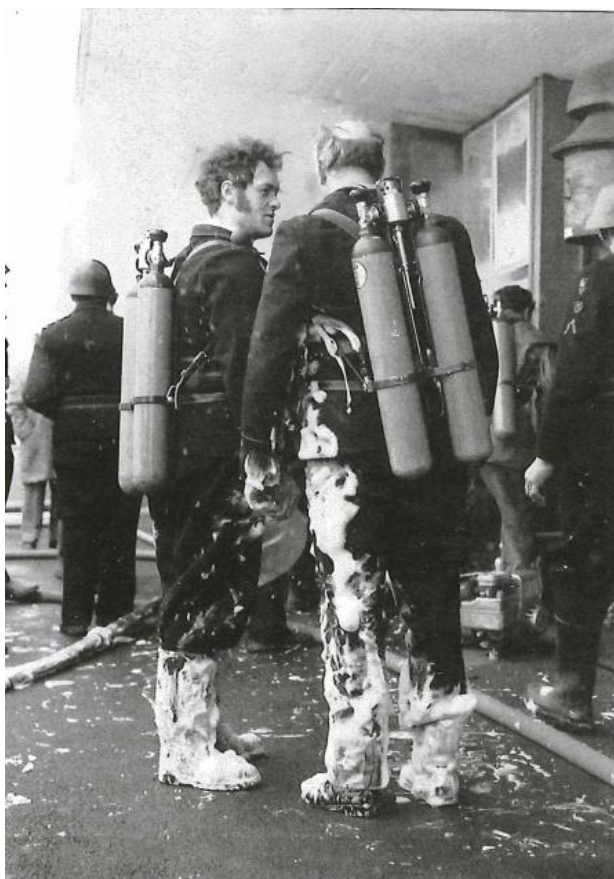
Bild 1 (links): Feuerwehrleute des Gasschutztrupps nach ihrem Einsatz im Keller der SBB-Station Bad Ragaz. Der Schaum, der bis über die Knie reicht, verdeutlicht die intensiven Löscharbeiten.

Die Männer des Gasschutztrupps rückten als erste zum Brandherd vor. Nach ihrem Einsatz waren sie bis über die Knie mit Löschschaum bedeckt, ein sichtbares Zeichen für die anspruchsvollen Bedingungen. Wie aus dem Kommandantenbericht von Ernst Gaffner hervorgeht, erforderte die Brandbekämpfung insgesamt vier Gastrupp-Einsätze, bevor die Ursache und das Ausmass des Feuers abschliessend geklärt werden konnten. Der Einsatz dauerte insgesamt sechs Stunden, bis der Brand gelöscht sowie der Brandschutt und das Löschwasser beseitigt waren.