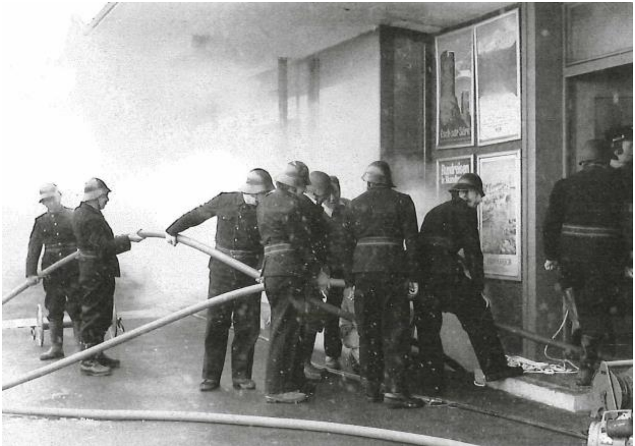
Bild 3: Feuerwehrleute arbeiten koordiniert vor dem Eingang des Stationsgebäudes, um Schläuche zu legen und den Einsatz vorzubereiten, während dichter Rauch aus dem Gebäude dringt.