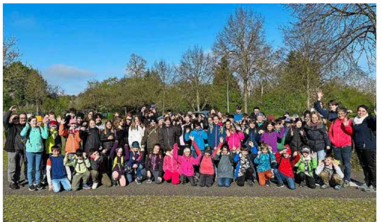
Ihren Tag in Rust voll ausgekostet: Die Ministrantinnen und Ministranten der Seelsorgeeinheit Walensee haben grossen Spass im Europapark.